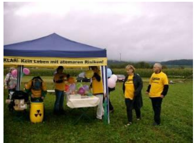
Fotos von der Benken-Demo